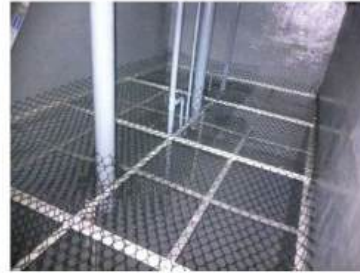
ろ材棚(微生物の住処を設置する)