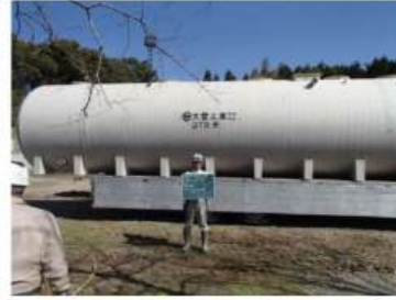
弊社の製品(浄化槽)