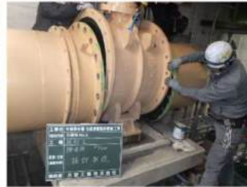
大型バルブの更新(設置)