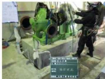
大型ポンプの据付