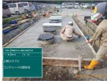
埋戻し後 上盤コンクリート