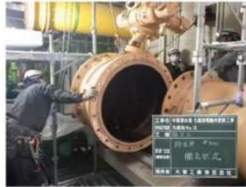
大型バルブの更新(撤去)