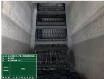
川のゴミを取る機械(除塵機)